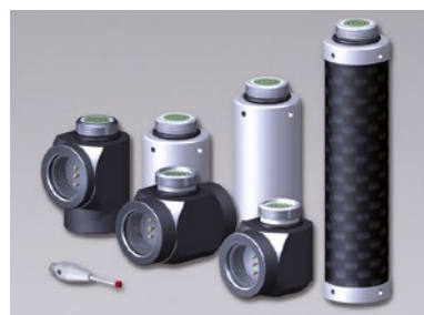
Disponibili vari accessori