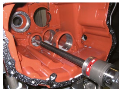
Alta produzione di scatole cambio