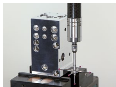
Misura in spinta e tiro