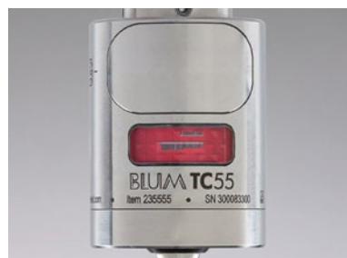
信頼性の高いステンレス製の筐体