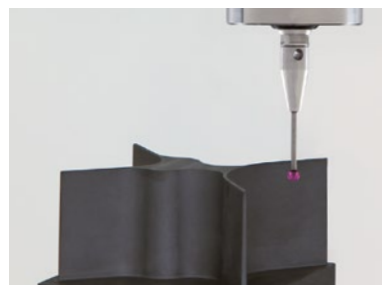
TC55 - 小型マシンングセンタでの繊細なワーク測定に対応