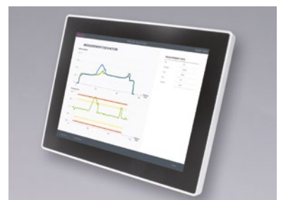
Analyse sur l'écran de la commande ou le panneau tactile BLUM