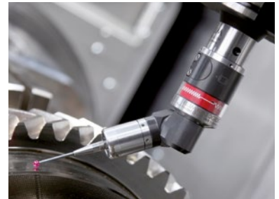
DIGILOG TC63 – système modulaire