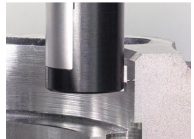
TC63-RG mit Single-Messelement zur Prüfung von geraden Werkstückgeometrien