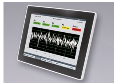
Auswertung am Steuerungsbildschirm oder BLUM Touch Panel