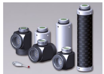
Optionen und Zubehör